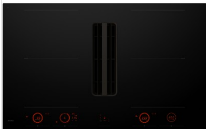
Table de cuisson à induction Elevate™ avec extraction intégrée, encastrée noire à fleur (83 cm) HIDD28471SVI Atag