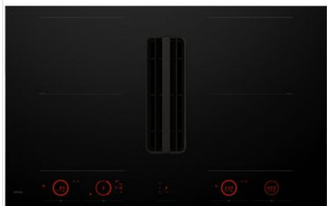
Table de cuisson à induction Elevate™ avec extraction intégrée, noir (83 cm) HIDD28471SV Atag